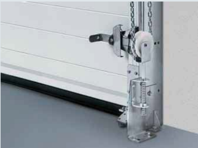
Valinnainen lisävaruste: ketjukiristin helpottaa käyttöä