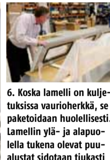
6. Koska lamelli on kuljetuksissa vaurioherkkä, se paketoituaan huolellisesti. Lamelliin ylä- ja alapuolella tukena olevat puualustat sidotaan tiukasti kiinni muovilla, joka estää myös likaantumisen.