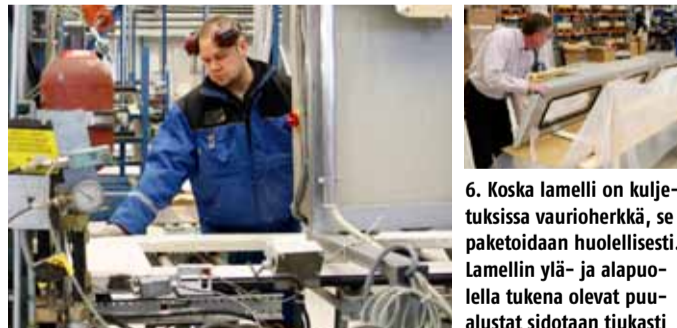
5. Lamellia sahataan määrämittaan asiakkaan tilauksen mukaisesti ja varustellaan, tässä tapauksessa ikkunalla.