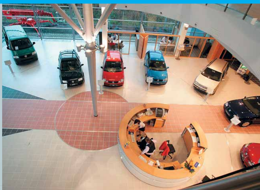
Volkswagen-autotalo Kerava edustaa arkkitehtuurisine ratkaisuihine kehityksen kärkeä Suomessa.

– Kaikki myytävät autot, myös vaihtoautot, ovat esillä lämpimissä sisätiloissa, joista asiakas pääsee syksyn kurakeilla tai talvipakkasilla aina lämpimällä ja puh-