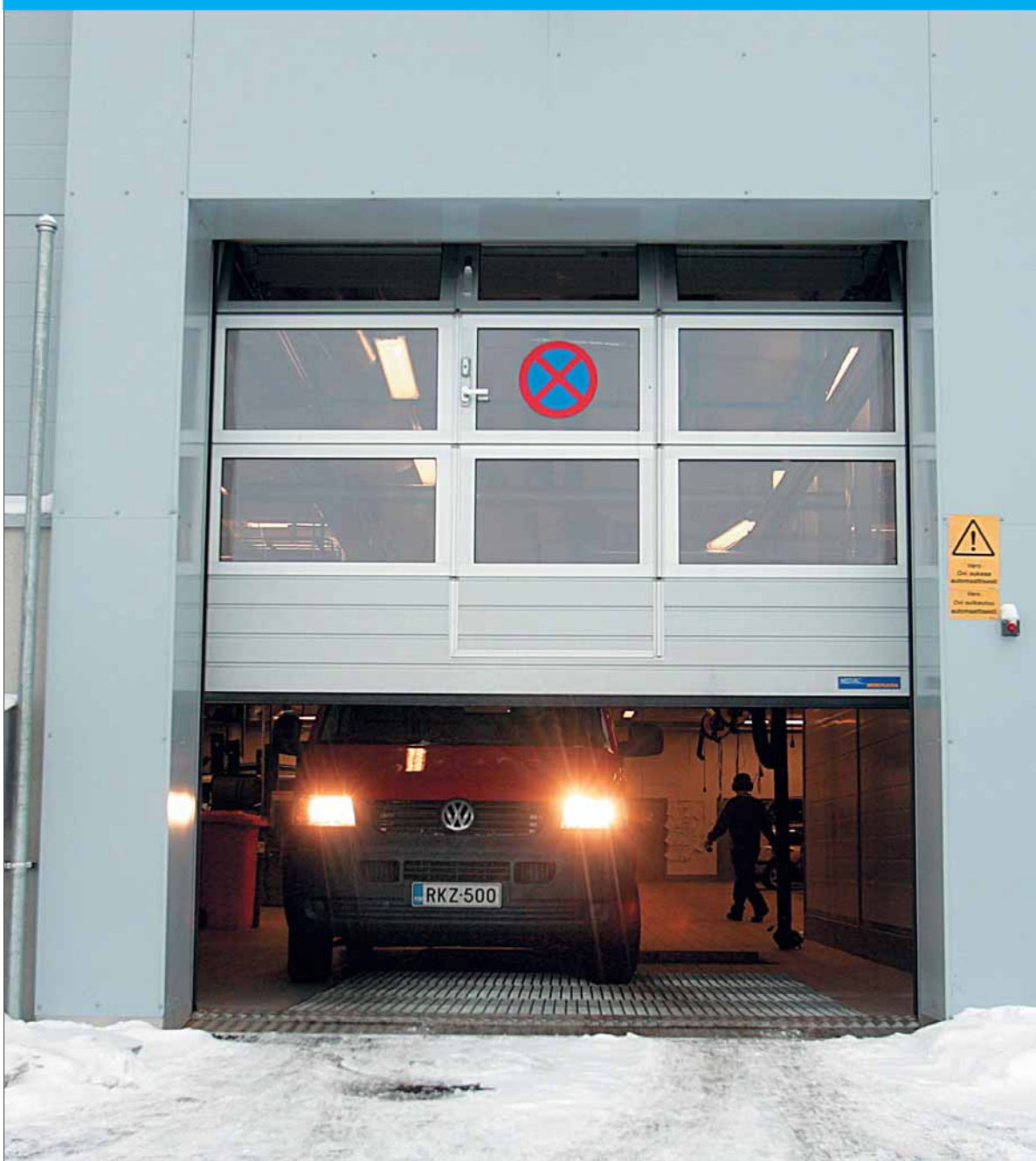
Mesvacin toimittamat Volkswagen-autotalo Keravan huoltokorjaamotilan alumiiniprofiilinosto-ovet ovat toteutettu ikkunaruuuilla sekä käyntioivella.