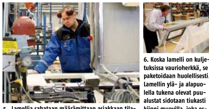
5. Lamellia sahataan määrämittaan asiakkaan tilauksen mukaisesti ja varustellaan, tässä tapauksessa ikkunalla.