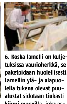
6. Koska lamelli on kuljetuksissa vaurioherkkä, se paketoitetaan huolellisesti. Lamelliin ylä- ja alapuolella tukena olevat puualustat sidotaan tiukasti kiinni muovilla, joka estää myös likaantumisen.