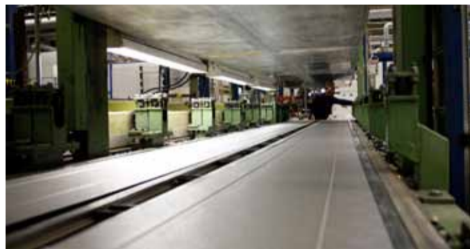
4. Vaahdotettu lamellisetti on valmis purettavaksi pois vaahdotusmuotista.