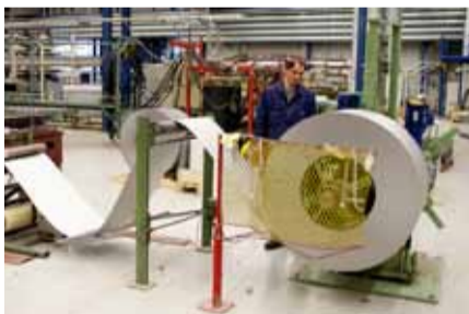
1. Lamellin tuotanto alkaa siitä, että ensin tehdään tyhjä peltikotelo, joka muodostuu kahdesta 60 senttiä leveästä peltirainasta. Ensimmäisessä työvaiheessa syöttölaite syöttää alumiini- tai peltikelasta materiaalin mittalaitteen ja leikkurin läpi, minkä jälkeen profilointikone tekee rainaan reunamuodot ja vahvikeurat.