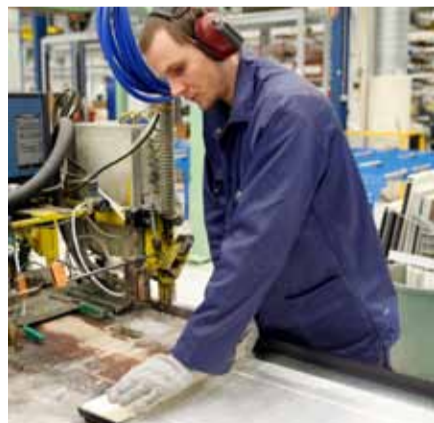
3. Muoviliistalla toisiinsa liitetty valmis peltikotelo menossa kuljettimella vaahdotusmuottiin.