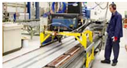
2. Katkaistu pelti ajetaan muovauskoneen läpi, jossa se muotoutuu siten, että se voidaan liittää PVC-muoviliistalla yhteen toisen kappaleen kanssa.

Varastossa on hyllytilaa kaksin verroin vanhaan tehtaaseen verrattuna. Varaston korkeus on 7 metriä ja hyllykorkeus vajaa 6 metriä. Tavaraa liikutellaan kahdella erikoisvalmisteisella trukilla. Pienvaraosien keräily hoidetaan yhdeltä luukulta Pater-varastonostimella, joka on eräänlainen pystysuoraan pyörivä leveä hyllystö. Varasto on selkeästi erotettu myös muusta tuotannosta.