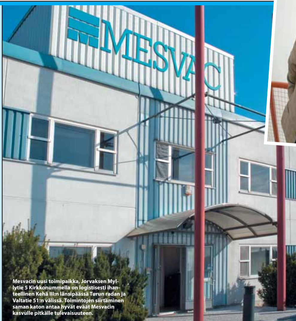
Mesvacin uusi toimipaikka, Jorvaksen Myllytie 5 Kirkkonummella on logistisesti ihanteellinen Kehä III:n länsipäässä Turun radan ja Valtatie 51:n välissä. Toimintojen siirtäminen saman katon antaa hyvät eväät Mesvacin kasvuille pitkälle tulevaisuuteen.

Muutamme vuoden 2009 alussa osoitteeseen Jorvaksen Myllytie 5, 02420 Jorvas.