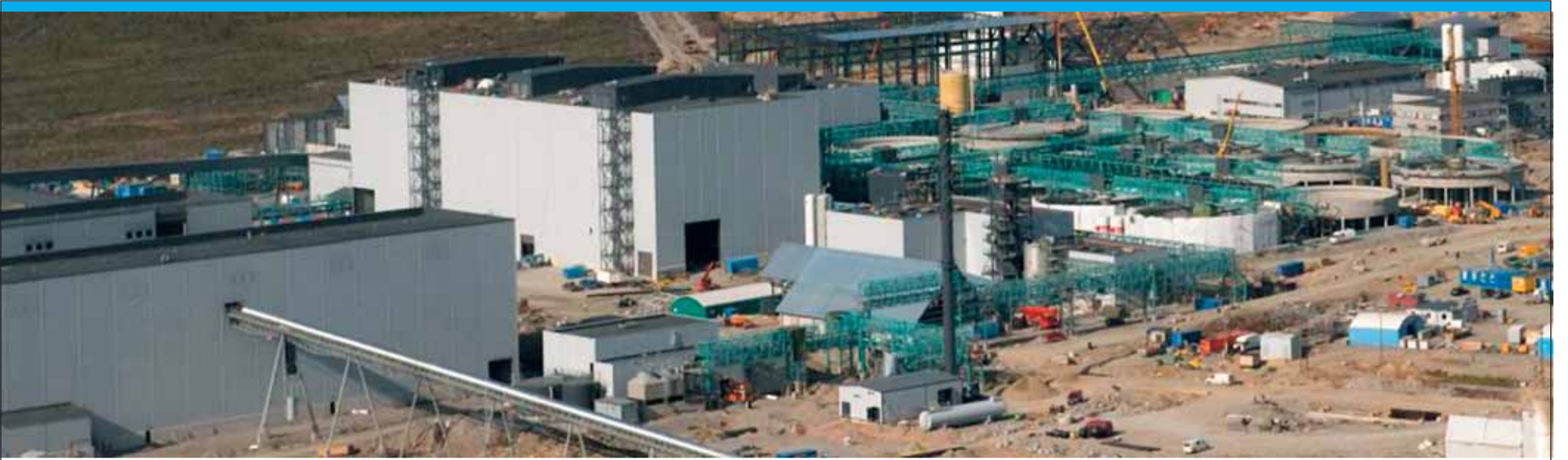
Talvivaaran yli 60 neliökilometrin kaivosalueelle valmistuu kaiken kaikkiaan 813 000 neliometriä erilaisia rakennuksia.