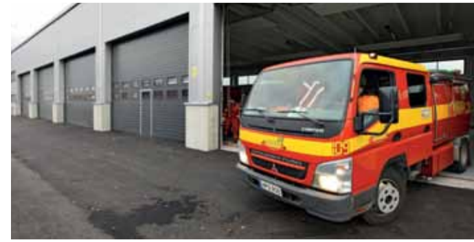
Mesvacin Juvanmalmille toimittaman 7 metriä leveän ja 4,5 metriä korkean nosto-oven käyntiovi on kynnysksetön. Alimmainen lamelli on säädettävä, ja se imeytyy kumitiivistein suoraan lattiaan. Ratkaisu on ensimmäinen lajissaan koko Suomessa.

– Tietojärjestelmän ansiosta ovi saadaan kerralla kuntoon. Se säästää paitsi rahaa, myös lyhentää häiriöstä aiheutuvaa haittaa liiketoiminnallenne, Marko Parkkali korostaa.